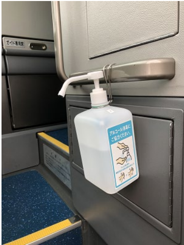
▲バス入口に消毒液を設置