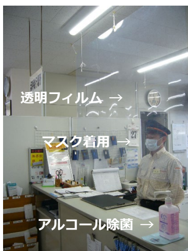
▲点呼台飛沫感染防止の様子