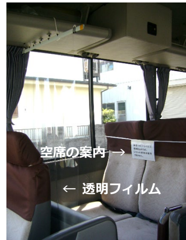
▲マイクロバス飛沫感染防止の様子