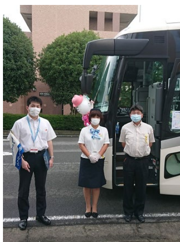
▲乗務員マスク着用の様子