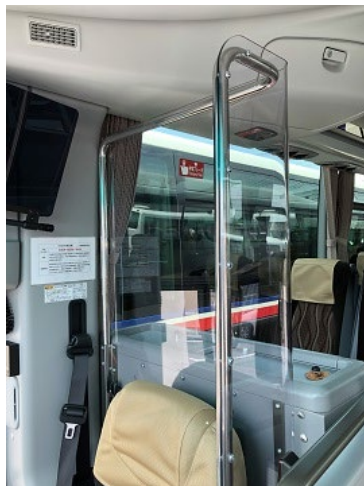
▲大型バス飛沫感染防止シールド