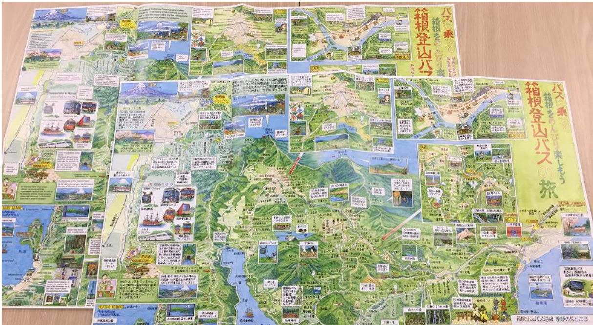
イラストマップ(絵地図による沿線案内)